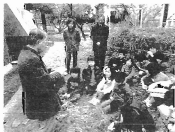
カムフラージュの生態を学ぶ