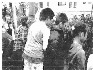
隠されている物を探す2年生

新しいプログラム—自分の好きな色を4色選んで、それと同じ色の自然物をさがしてくる活動です。はじめに自然界の生き物の生きていくちえを学ぶ、「カムフラージュ」で、草むらや木に隠した、人工物を探してもらうゲームを行った。これは色がとけこんでしまうから全部探すのは難しい。しかし、子どもたちは真剣に探して、20個中18個探した子もいました。写真集から、カムフラージュして生きる虫たちの生態を学習。その後、好きな色を選んで、その色と同じ色を自然界から探し出す活動を展開。2年生は青系の色を好む子も多かったが、どんどん探し出して、発表出来ました。