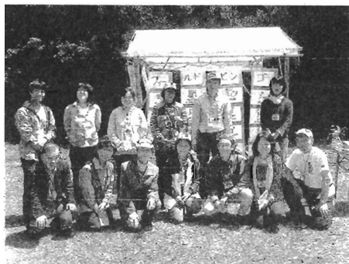
研修生の皆さんはアースデーでのSOEの活動にも参加

静岡県三島にあるNPO法人グランドワーク三島は、1980年代にイギリスではじまった、地域の様々な団体が協力して、その地域の環境まちづくりを進める統合的な団体です。その結果、実践的な環境教育、環境再生、地域再生、農業再生、コミュニティビジネスなどの活動で、各種賞を受け、全国的に知られる環境団体です。今回、政府の地域社会雇用創造事業の予算を受け、始めた「インターンシップ三島グランドワーク」の事業は、研修生を集め、全国の環境などの団体で、自由に研修を受けさせ、修了証を授ける研修制度です。この研修をきっかけ