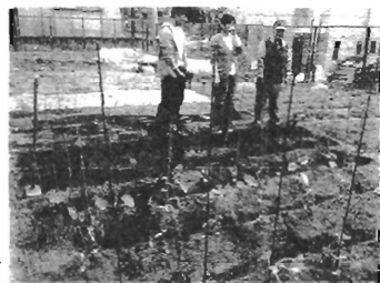
東京赤塚野菜づくり 区民農園で植え付け