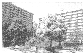
蓮根第二小学校 学校ビオトープ

..... ニュースフラッシュ ◆ 早いもので、9月30日にセンスオブアースは誕生1周年を迎えました。会員のみなさま、このニュースをお読みいただいているみなさま本当にありがとうございます。 ◆ センスオブアース誕生のきっかけとなった『板橋区立蓮根第二小学校』の学校ビオトープが今年の12月で5周年を迎えます。メダカ、カエル、トンボ、バッタ、デンジソウ、ヨシなど、多様な生きものが生息し、コンクリートの都市でもビオトープが生き続けられることを証明しています。11月5日に行われる記念イベントで、センスオブアースはネイチャーゲームの企画運営をお手伝いします。校内の自然を生かした楽しいゲーム