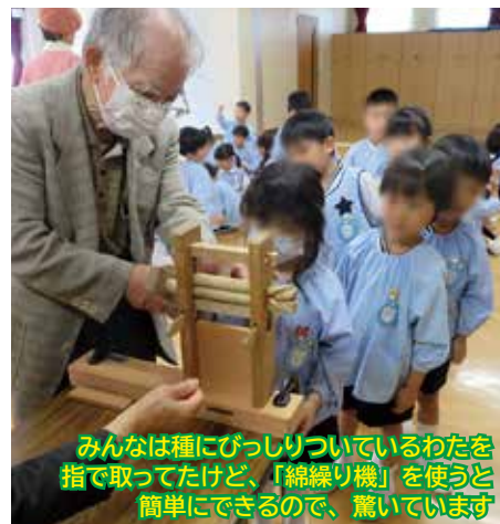
みんなは種にびっしりついているわたを指で取ってたけど、「綿繰り機」を使うと簡単にできるので、驚いています

飽きずに楽しんでいた」「クイズや紙芝居を通してわかりやすい内容であった。年長組のみんなもとても喜んでいました。興味や関心があり、話も聞き、積極的に発言もして楽しかったです」