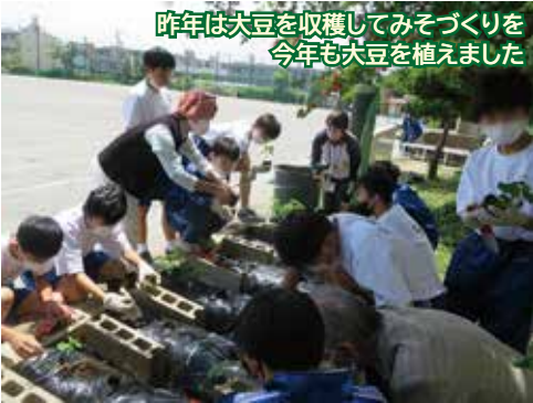
昨年は大豆を収穫してみそづくりを 今年も大豆を植えました