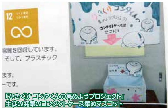
「かきくけ コンタくんの集めようプロジェクト」 生徒の発案のコンタクトケース集めマスコット