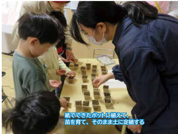
紙のできたポットに植えて、苗を育て、そのまま土に定植する

～ひろがるひろがるわたの栽培～ SOEが育て収穫した「わた」の種を今年も希望団体へお届けしました