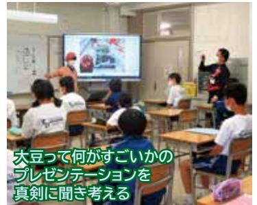
大豆って何がすごいかの プレゼンテーションを 真剣に聞き考える