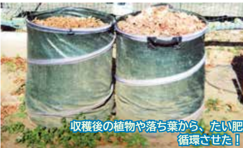
収穫後の植物や落ち葉から、たい肥循環させた!

「4年程前にユネスコスクール加盟を申請してから、その活動を継続しているのを認められました」 「授業では、美術の授業で環境のポスターを作ったり、理科の授業で使っている消費電力量と電気料金を調べて、節電の大切さを学んだりしました。また、特別支援学級や園芸部が中心になって、ひまわりやピーマン、なす、トマト、きゅうり、トウモロコシ、ブロッコリー、カリフラワー、大豆、わた、ベリー、バナナな