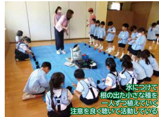
水につけて根の出た小さな種を一人ずつ植えていく注意を良く聴いて活動している

先生より▶▶「わたが植物だというおどろき!」「衣服は身近で親しみやすいものだったことも楽しんでいた」「保育者も初めて知ることや、わたと種を分ける機械など初めて見るものもあり、とても勉強になった」