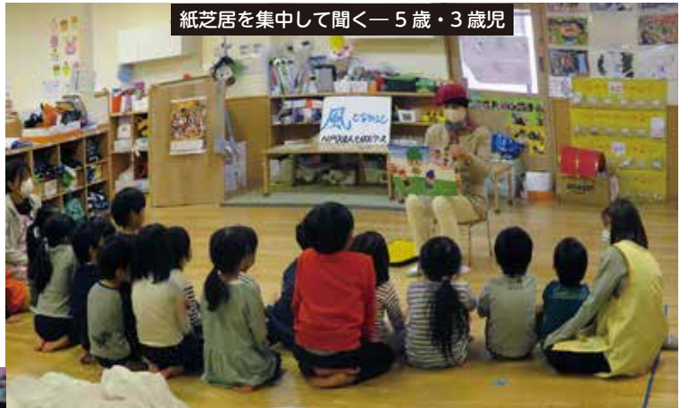
紙芝居を集中して聞く—5歳・3歳児

☺フーがなくていい。なかないでほしい。☹フーちゃんいい子だった。☺なかなかおりでできてよかった。—やさしい子たちですね。かざぐるま・紙トンボ、とっても楽しかったそうです。