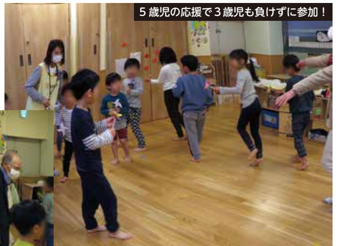
5歳児の応援で3歳児も負けずに参加！