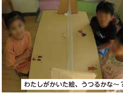
わたしがかいた絵、うつるかな~?

5歳児さんたち、この喜びよう。 だれかが壁に映すのに、寝てみた らうまくいったので、みんなまねし ちゃった!!