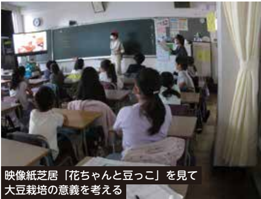
映像紙芝居「花ちゃんと豆っこ」を見て大豆栽培の意義を考える