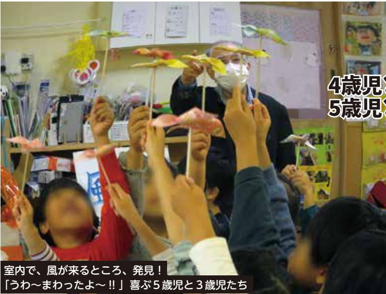
室内で、風が来るところ、発見！ 「うわ～まわったよ～!!」喜ぶ5歳児と3歳児たち

二日にわたり、学年ごとと3歳児さんが半分ずつ参加、「風となかよし」を行いました。みんなで、かざぐるまと紙トンボ作り。3歳児さんも負けずに取組みました。3歳児から5歳児まで、助け合っ