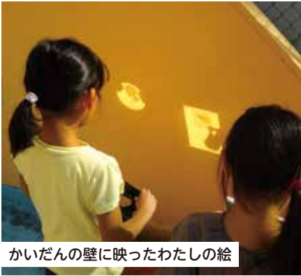
かいだんの壁に映ったわたしの絵

「ねっころがってうつす のがたのしかった~」 「ケロスケを見つけてう れしかった」