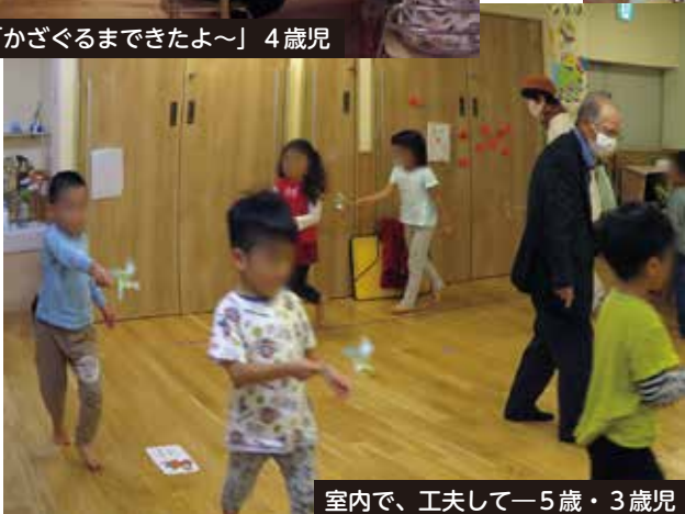
室内で、工夫して—5歳・3歳児