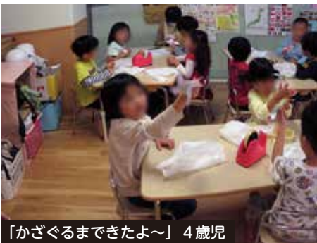
「かざぐるまできたよ～」4歳児