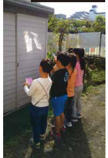
倉庫に映しちゃった!