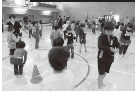
できたよ～、わたしの風車、きれいでしょ