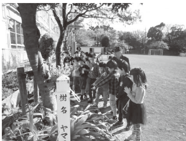
導入—カムフラージュ— 生きものが擬態を使って身を隠すこと