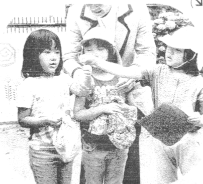
たからものの発表・栄町保育園

タンポポやハルジオンの花によく来る、モンシロチョウやベニジミが飛び交っています。よく見ると、自然のままの野草がいっぱいの中にいろいろな野花が咲き乱れていて、虫の隠れ家もあるし、ちょうが花の蜜もたくさんすえるからでしょう。