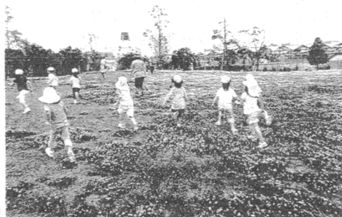
シロツメクサを踏んで走る・さかうえ保育園児

園長先生より —キロリのおにごっこで、ほし組さん(4歳児)がよくがんばっていた。たからさがしが楽しかった。色々発見できたね。 保護者より —ありの巣を見つけた。この年でまじまじと見られた。みんなが喜んで探している様子が見られた。