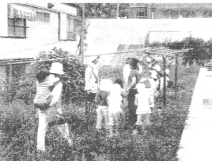
ちょうが飛び交う栄町保育園のうら庭で

春の真っ盛りのこの時期。生きものたちが大躍動しています。豊かな生態系のある栄町保育園園庭や、さかうえ保育園近くの北区の自然公園で、それぞれの園児、4・5歳のこどもたちが手をつないで、探検に出かけました。『アオスジアゲハのお母さんが病気になってしまったから、子どものいもむしたちが自然の贈り物を探して贈り物をする』話です。こどもたちは、5歳の子が4歳の手をつなぎ、真真なお顔で、さがして歩いていきます。(2ページ下へ)