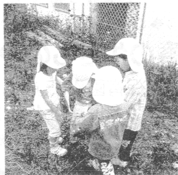
これ見つけたよね・栄町保育園

さかうえ保育園児がおとずれた北区立自然公園には、たくさんの自然のままの雑木林のほかに、それは素晴らしいシロツメクサが絨毯のように咲き乱れる広場があります。