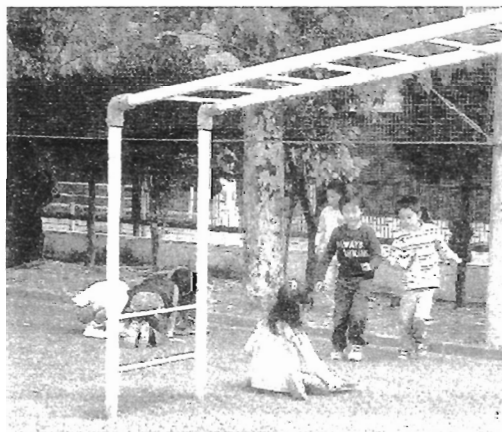
学校中のいろんな所から 子供たちの見“つけた～”の元気な声

後半は授業の山場、「フィールドパターン」です。自然の中から、○、□、W、Y、☆型のもの…等を探すゲーム。「あったー。丸い形してるー!」「先生。これ何て言うの?」普段何気なく見ている校庭から、ピオトープから、子ども達は予想以上に色々な形を見つけ出してくれました。その結果、全体シェアリングは大変有意義なものとなりました。