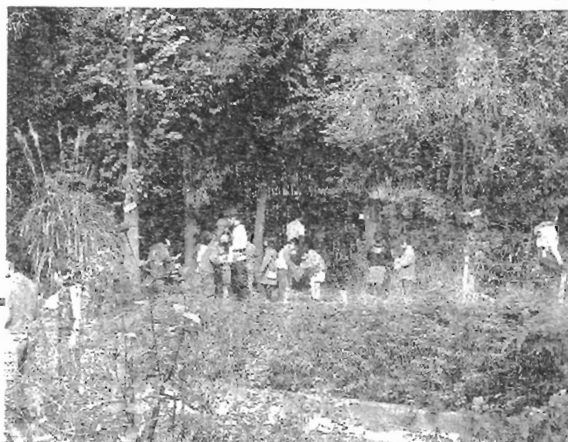
子供たちが“うらには”と呼んでいるのは三園小学校の誇る葦山ビオトープ