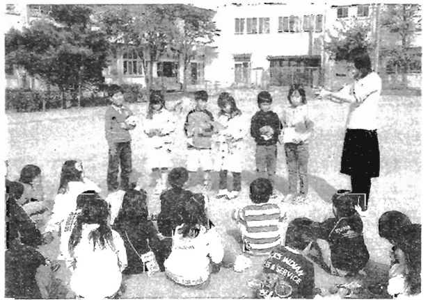
最後の合同発表、熱心にシェアリングする2年生

担任の先生「こんなに集中して探すとはびっくりした。」「きちんとテーマを持って活動するといいとわかった。教師が発見があった。」「こんなに子どもたちは自然に関心が向くんだなーとわかった。」